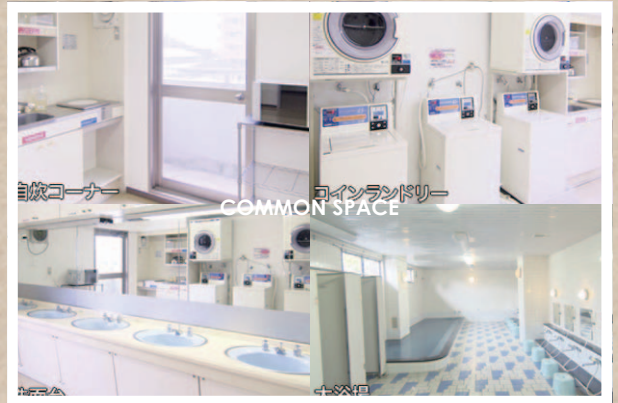
談話しつにはピアノがあります。 ランドリールームは洗濯無料です。