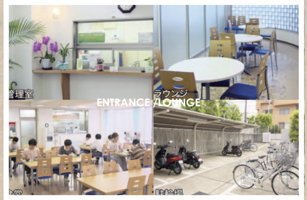
明るい雰囲気です。

運営会社：株式会社 S-FIT E-mail : gakusei@sfit.co.jp