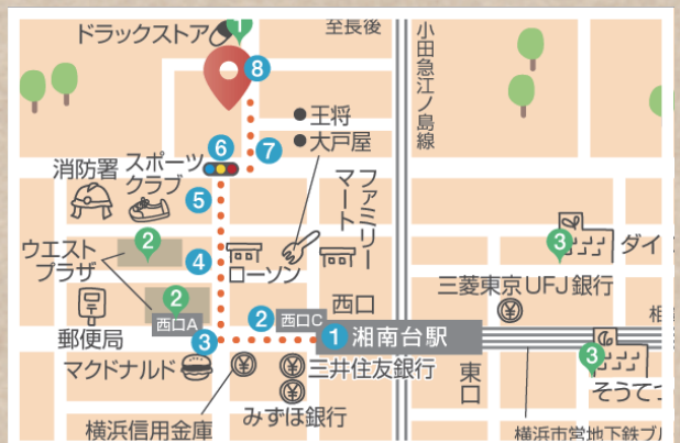
「湘南台」駅西口まで徒歩 4 分です。