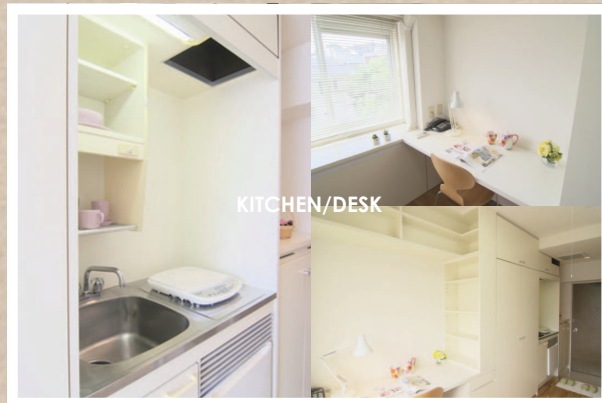
KITCHEN / DESK