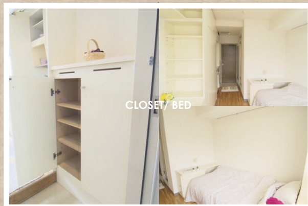
CLOSET / BED