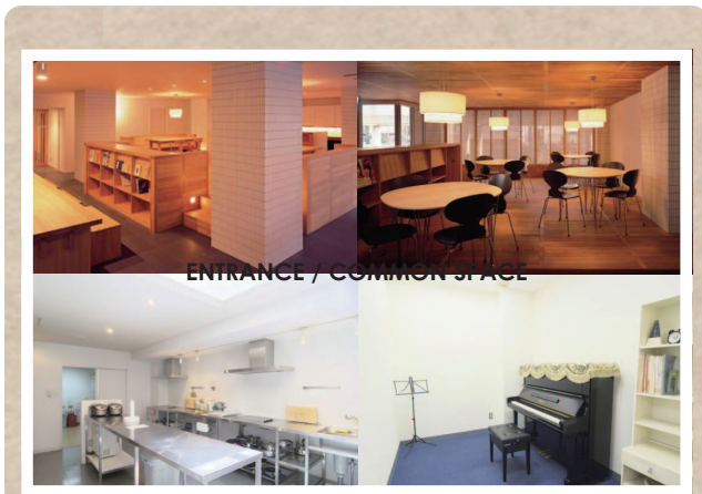
ENTRANCE / COMMON SPACE

運営会社：株式会社 S-FIT E-mail : gakusei@sfit.co.jp