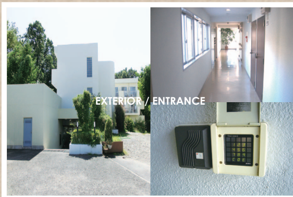
EXTERIOR / ENTRANCE