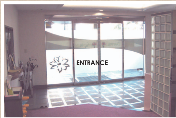
明るい雰囲気のエントランス。