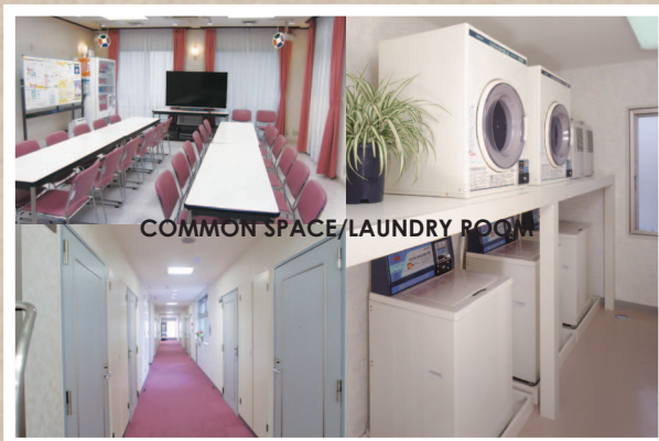
乾燥機付きで雨の日も安心。