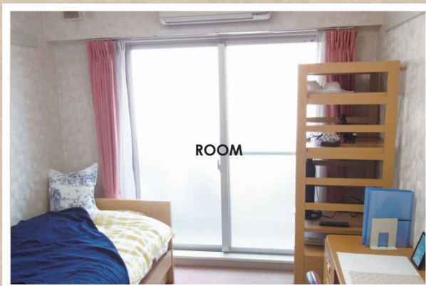
ウォシュレット付きのお部屋です。