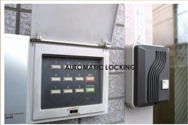
オートロック機能付き。

運営会社：株式会社 S-FIT E-mail : gakusei@sfit.co.jp